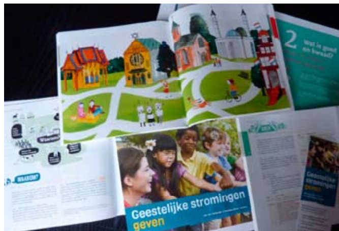
Auteurs: Jos van Remundt en Marleen Boon-Jansen Illustraties: Charlotte Bruijn

maakt werk van een betekenisvolle school