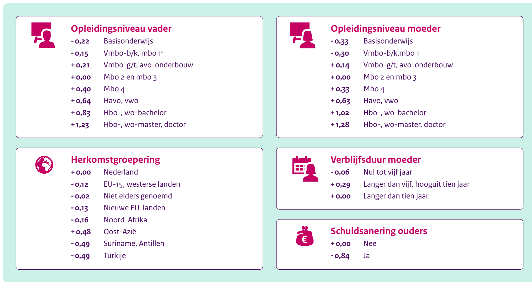
Figuur 1. Hoe berekent het CBS de onderwijsscore van de leerling?